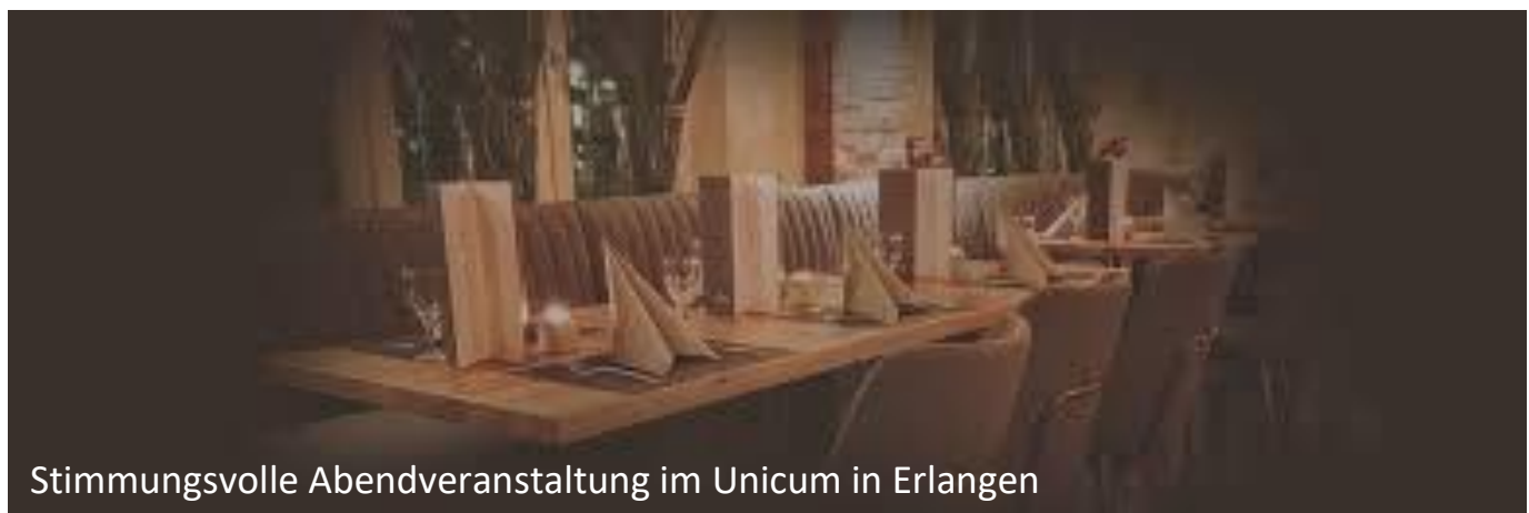
Stimmungsvolle Abendveranstaltung im Unicum in Erlangen