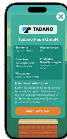
Abbildung 2: Erste Skizze eines Steckbriefs