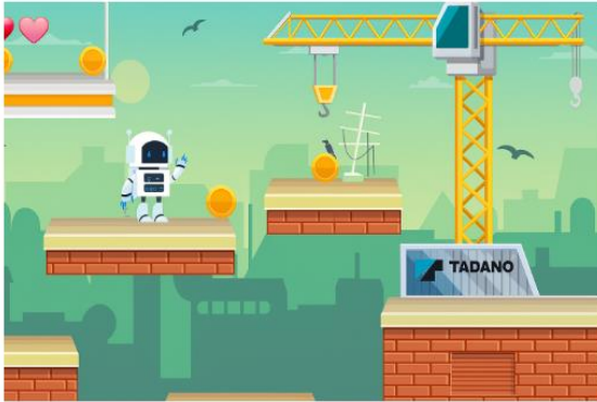
Abbildung 3: Beispielhafte Darstellung eines statischen personalisierten Assets (Kran) im Plus-Paket