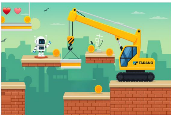
Abbildung 4: Beispielhafte Darstellung eines animierten personalisierten Assets (Kran) im Premium-Paket - Spieler:innen müssen einen Button betätigen, um mit dem Kran ein Wegstück anzuheben und vorwärts zu kommen.